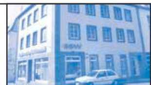
Stadtwerke St. Wendel