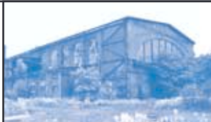
Burbacher Hütte, alte Halle

Modellhafte Sanierung und Revitalisierung des Burbacher Hüttengeländes vom Rückbau alter Industrieanlagen über die erfolgreiche Bodensanierung bis zur Sanierung der Versorgungsanlagen, Tandem Photovoltaik + BHKW im Saarbrücker Innovations- und Technologiezentrum SITZ, Lärmschutzwand mit integrierter Photovoltaik am Saarbrücker Autobahn-Dreieck Güdingen, Gichtgasleitung von der Halberger Hütte zum Heizkraftwerk Römerbrücke.