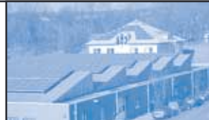
Tandem Photovoltaik + BHKW im SITZ