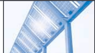
Lärmschutzwand am Auto- bahn-Dreieck SB/Güdingen