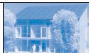
Niedrigenergiehaus Saarbrücken (Modell)