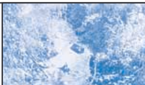
Grundwasserschutzkonzept Scheidter Tal

Örtliche Energiekonzepte , z. B. für Blieskastel, Bostalsee (Ferienpark), Bous, Luxemburg / Kirchberg, Saarlouis, Saarwellingen, St. Wendel; Gutachten Transportkonzept Saarausbau, Aufbau Umweltmanagementsystem im VVS-Konzern für die Bereiche Wassergewinnung, Wasserverteilung, Gasversorgung; Biomassestudien für Saarland und Stadt St. Wendel, Erschließung Solarpark Bübingen, Grundwasserschutzkonzept Scheidter Tal, Ver- und Entsorgungskonzept Wittersheim.