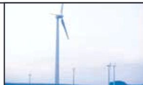
Windpark Freisen Nord